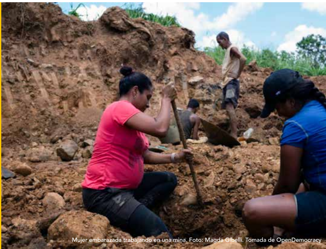
Mujer embarazada trabajando en una mina.