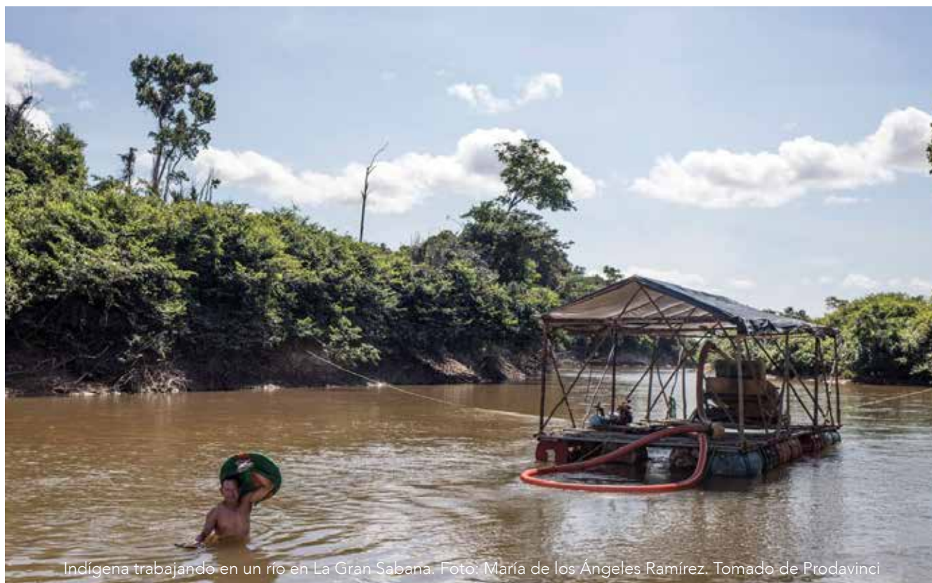
Indígena trabajando en un río en La Gran Sabana.

En este contexto, han sufrido de un grave incremento de la violencia, tanto en su forma tradicional de asesinatos, hostigamiento, estigmatización, esclavitud moderna, trata de personas, así como de violencia ambiental a través de la devastación y la contaminación de sus territorios, esta última por distintas sustancias, pero particularmente por el uso del mercurio en la explotación de oro 77 78 79 80 .