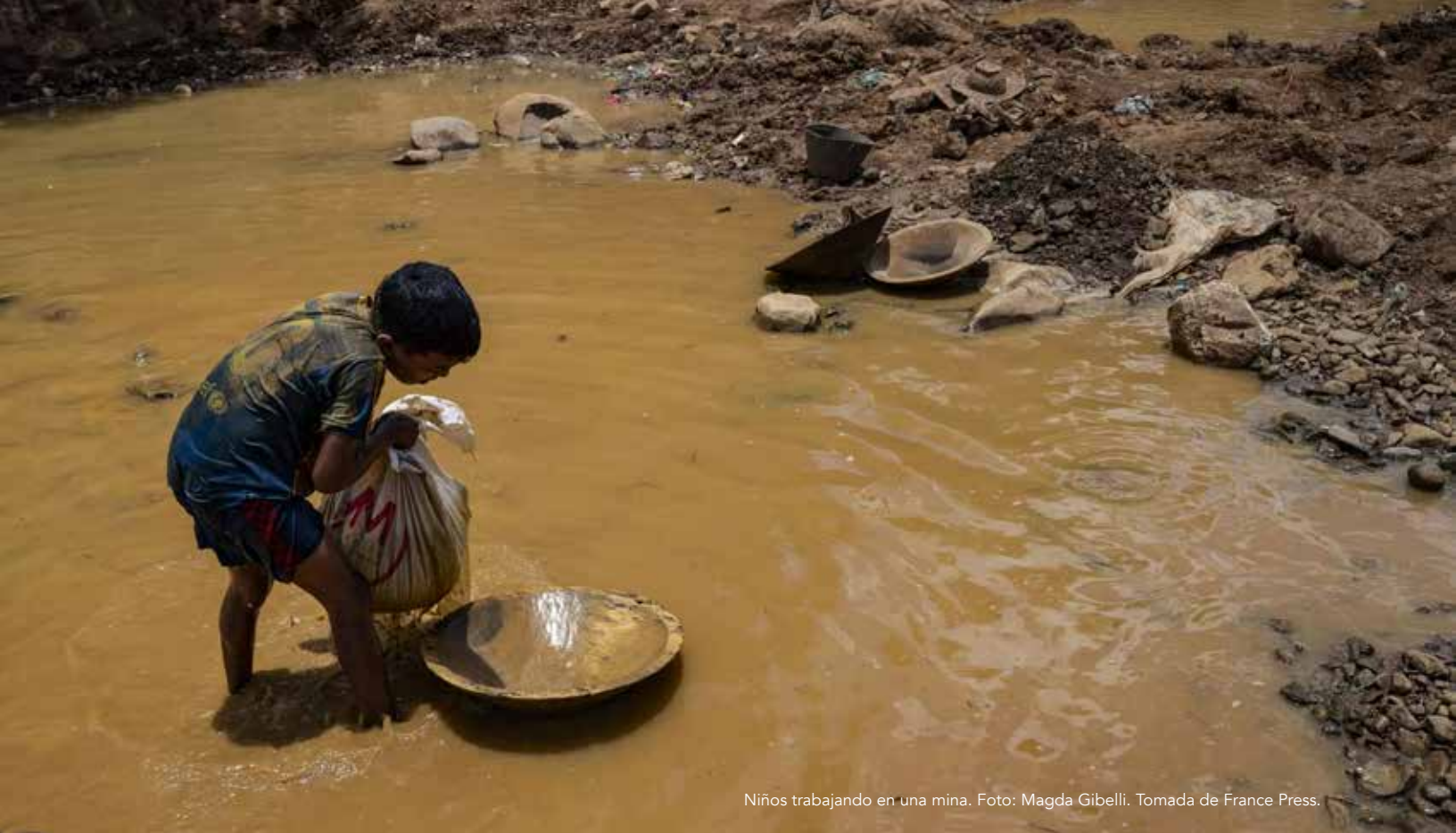
Niños trabajando en una mina.