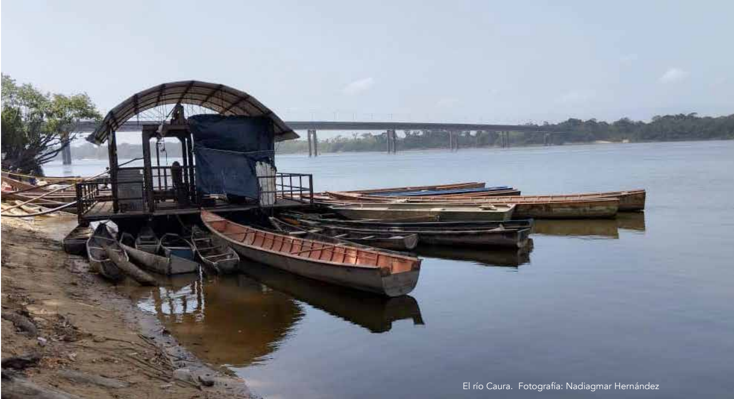
El río Caura.

realización de estudios en las zonas mineras al sur del país.