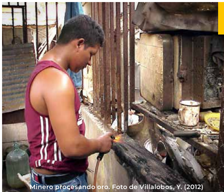
Mínero procesando oro.

En este sentido, el informe del Relator Especial sobre las implicaciones para los derechos humanos de la gestión y eliminación ambientalmente racionales de las sustancias y los desechos peligrosos del 2022 considera que “los abusos y violaciones de los derechos