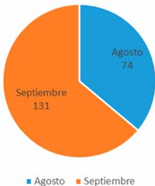
Personal de Salud Fallecido por COVID-19