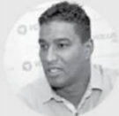
Delson Guárate El Limón-Aragua Desde el 2/9/2016