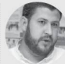
David Smolansky El Hatillo-Miranda TSJ dictó 15 meses de prisión (9/8/2017) En la clandestinidad