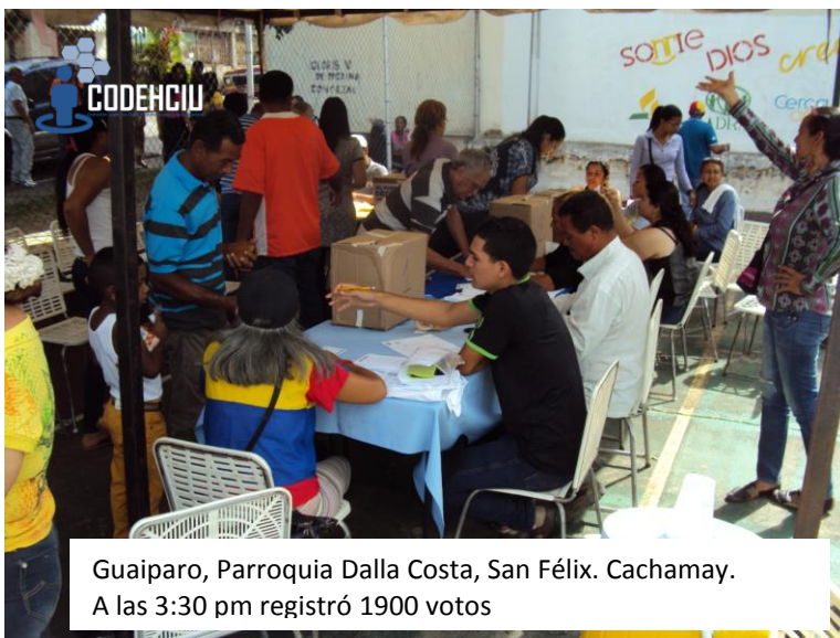
Guaiparo, Parroquia Dalla Costa, San Félix. Cachamay. A las 3:30 pm registró 1900 votos

Históricamente en el estado Bolívar los sectores populares, particularmente en San Félix, han registrado una votación que favorece al oficialismo, tendencia que con el devenir de los procesos electorales y el marcado deterioro de las condiciones de vida como la inseguridad, la pérdida del poder adquisitivo, la escasez, el hambre, y las precarias condiciones socioeconómicas