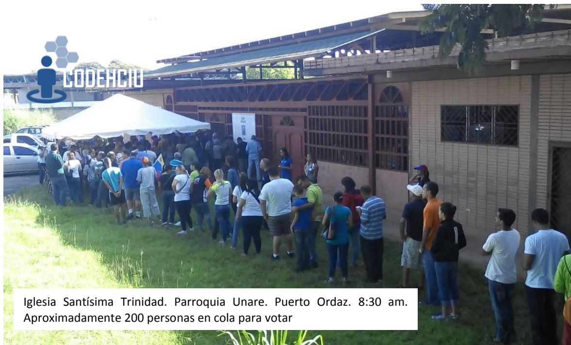
Iglesia Santísima Trinidad. Parroquia Unare. Puerto Ordaz. 8:30 am. Aproximadamente 200 personas en cola para votar

La Comisión para los Derechos Humanos y la Ciudadanía CODEHCIU monitoreó la consulta popular de este domingo 16 de julio, hecho histórico que responde a la convocatoria de la Asamblea Nacional a participar sobre el Rescate de la Democracia y la Constitución, bajo el amparo también del artículo 333 constitucional.