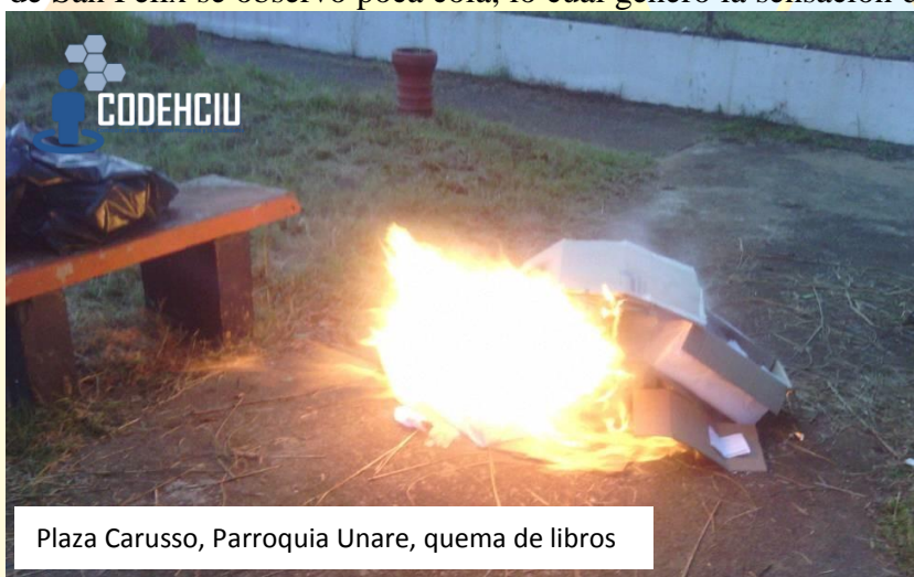
Plaza Carusso, Parroquia Unare, quema de libros

Puerto Ordaz evidenció más presencia de colas; puntos soberanos como el de Villa Colombia ubicado en la feria de alimentos, Villa Brasil (Casa de Primero Justicia), Unare (Santísima