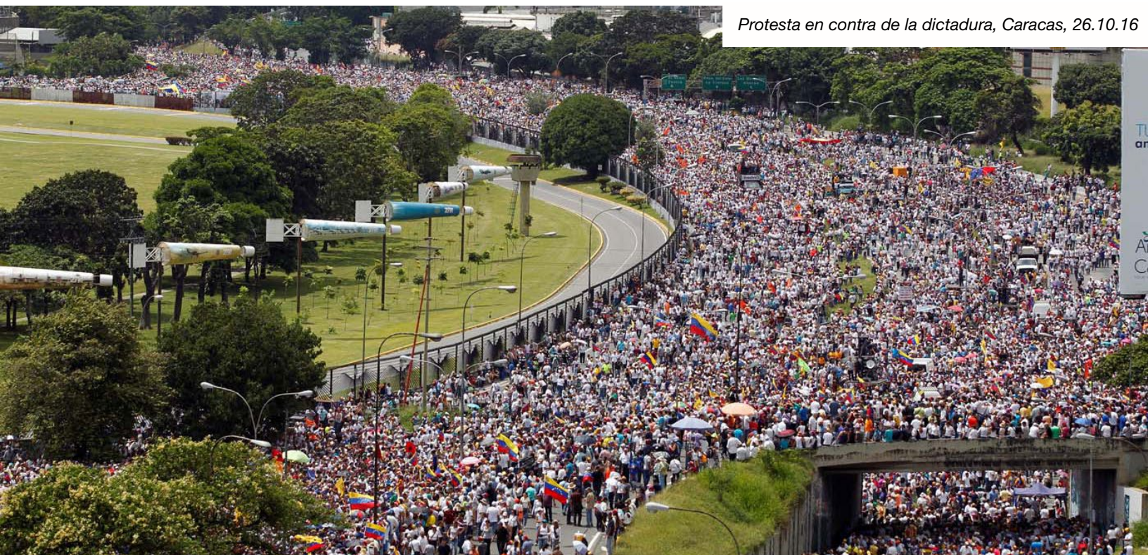
Protesta en contra de la dictadura, Caracas, 26.10.16

Otras organizaciones pidieron no hacer pública su adhesión